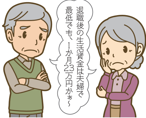
イラスト：矢野晶子

よいかわからないところも、相続問題が複雑でわかりにくいとされる理由のひとつです。そんな時に頼りになるのが、各分野の専門家と相談者をコーディネートし、老後設計と相続対策を含めたトータル資産管理、運用のアドバイスができるのが、ファイナンシャルプランナーです。